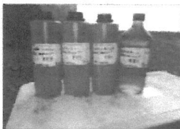
Fotografía 1: Set de Batería